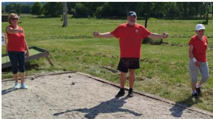
Turnaj v Klatovech