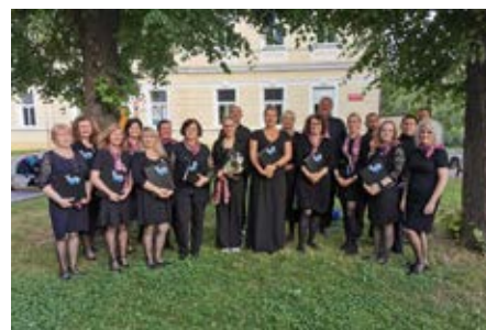
Sborový festival v Čakovicích

Hned o týden později jsme se 23. května podíleli na dobránské Noci kostelů. Na koncertě s názvem Na cestě k radosti jsme se pokusili ukázat, že kostel není jen místem modliteb, rozjímání, smutku či vážnosti, ale i místem naděje, radosti a třeba i smíchu. Tomu jsme přizpůsobili i výběr písní. Začali jsme velmi pomalu, velmi tiše a zcela beze slov, ale v průběhu koncertu jsme přidávali na počtu a frekvenci slov, tempu i hlasitosti. A tak se na závěr kostelem sv. Víta neslo společné „lach, lach“ z refrénu písně Lachtani Jarky Nohavici a dokonce i Jožin z bažin . Jak na konci poznamenal pan