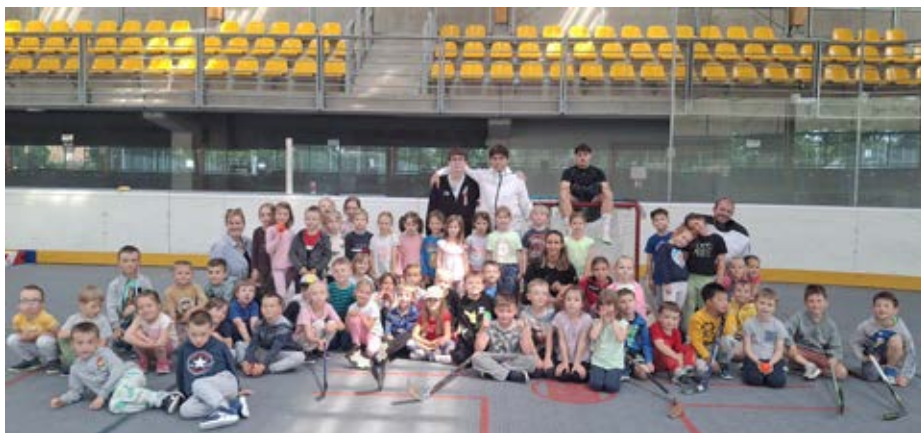
Červnové dopoledne s dětmi z MŠ Loudů